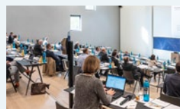
Keynote-Vorträge & Diskussionsrunden