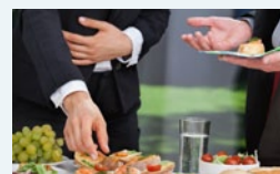
Empfang am Abend (Get-together)