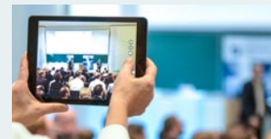
The VOICE of the NEXT GENERATION

Kreativpause u. a. mit Bewegung und Gesundheit – Qi Gong und Yoga