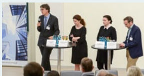
Keynote-Vorträge und Diskussionsrunde

mit namhaften Fachleuten und „branchennahen“ Verantwortlichen