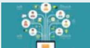
Call for participation

Masterstudierende & Gen Z geben einen Einblick