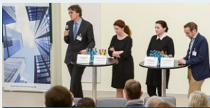
Keynote-Vorträge und Praxisbeiträge

mit namhaften Fachleuten und „branchennahen“ Verantwortlichen.