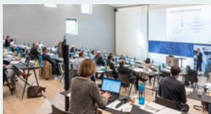
Keynote-Vorträge und Diskussionsrunden