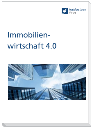
Immobilienwirtschaft 4.0 Herausgeber: Heike Gündling u.a.