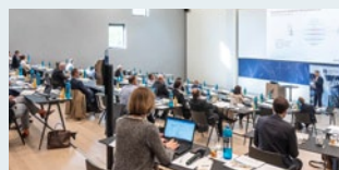
Keynote & Fachvorträge