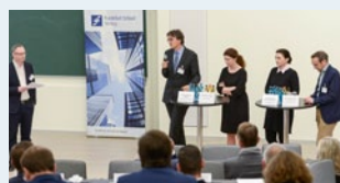
Keynote-Vorträge & Ask anything Session

mit Gelegenheit für Statements und Fragen aus dem Publikum.